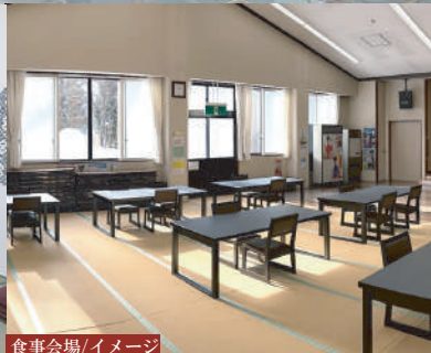
食事会場/イメージ